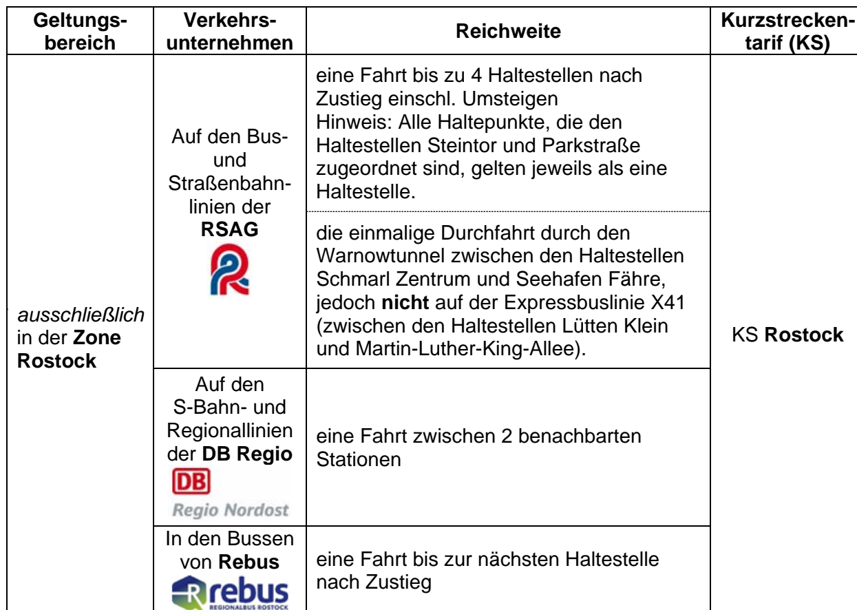
Tabelle 1: Gültigkeitsbereich der Einzelfahrkarten für eine Kurzstrecke

Der Gültigkeitsbereich der Einzelfahrkarten für eine Kurzstrecke ist in Tabelle 1 nach den Merkmalen Geltungsbereich , Verkehrsunternehmen , Reichweite und Kurzstreckentarif beschrieben.