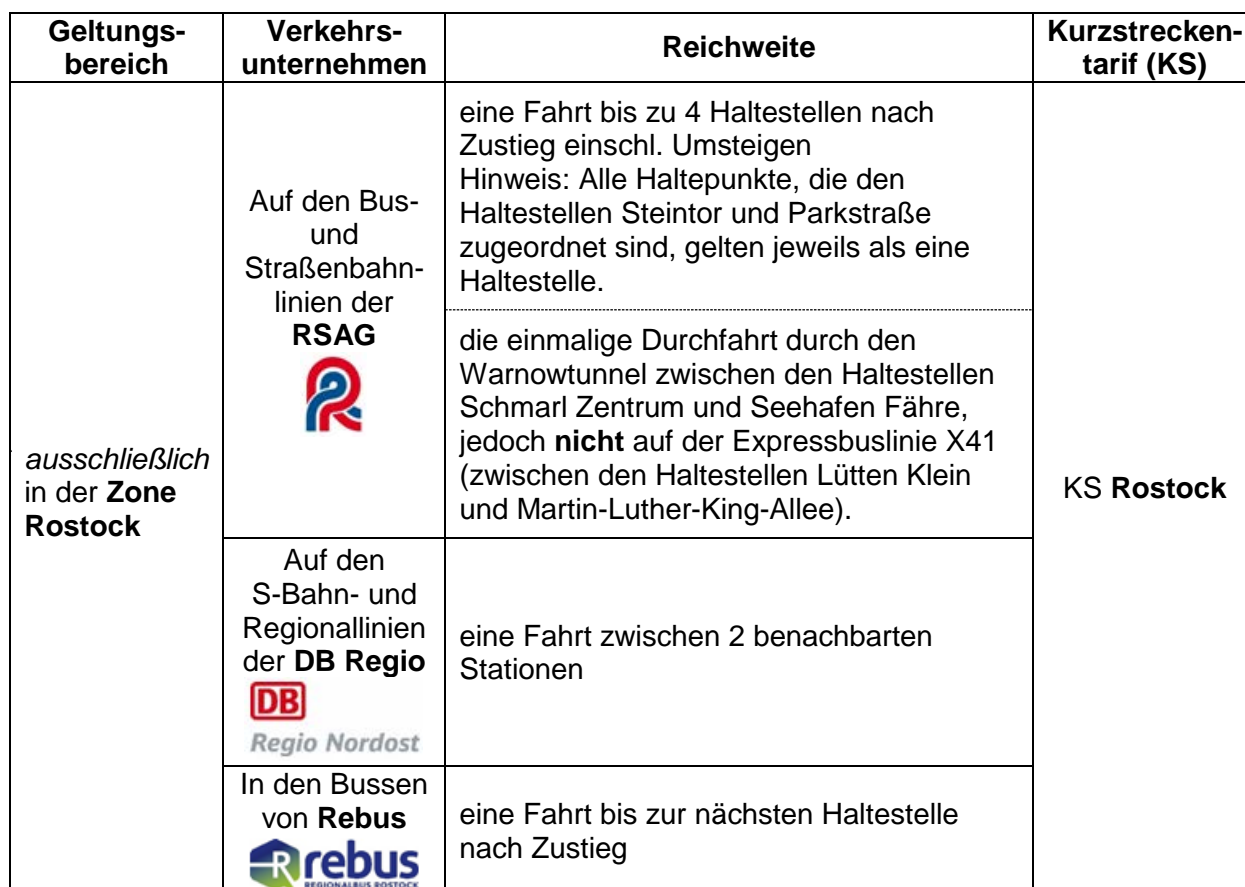
Tabelle 1: Gültigkeitsbereich der Einzelfahrkarten für eine Kurzstrecke

Der Gültigkeitsbereich der Einzelfahrkarten für eine Kurzstrecke ist in Tabelle 1 nach den Merkmalen Geltungsbereich, Verkehrsunternehmen, Reichweite und Kurzstreckentarif beschrieben.