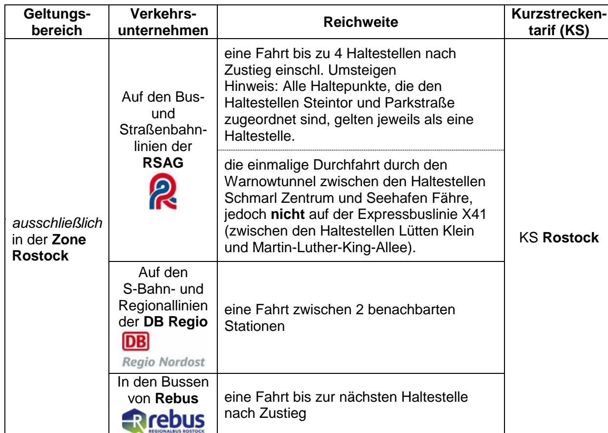
Tabelle 1: Gültigkeitsbereich der Einzelfahrkarten für eine Kurzstrecke

Der Gültigkeitsbereich der Einzelfahrkarten für eine Kurzstrecke ist in Tabelle 1 nach den Merkmalen Geltungsbereich , Verkehrsunternehmen , Reichweite und Kurzstreckentarif beschrieben.